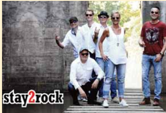
Am Freitag Abend ab 19 Uhr auf dem Buttermarkt rockt die Coverband "stay2rock" die Kempener Altstadt.