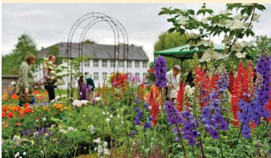
Wer nicht nur auf Rosen, Tulpen und Nelken setzt, sondern auch mal mit originellem Gewächs auffallen will, der findet im Bereich der Pflanzen besondere Raritäten und sicher das ein oder andere illustre Gewächs.