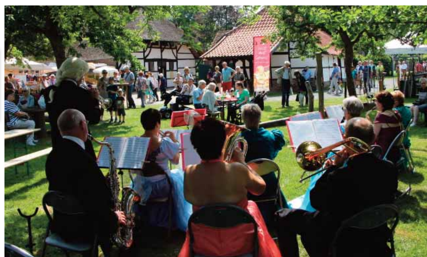
Den Termin sollte man sich vormerken: Über Pfingsten zeigen rund 100 Aussteller an der Dorenburg, wie das „GartenLeben“ besonders schön wird.