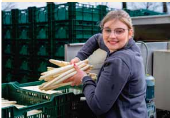
Endlich wieder Spargel! Die Spitzenqualität aus deutschem Anbau gibt es ab sofort wieder auf Wochenmärkten, direkt ab Hof oder in den Bio- und Supermärkten zu kaufen.

Aber vielleicht möchte man am liebsten ganz klassisch in die Saison starten, einfach, weil das auch so gut ist. Aromatische Spitzenstangen in Salzwasser mit ein bisschen Zucker und Zitronensaft gekocht, dazu köstliche Butter oder Sauce Hollandaise, ein paar Frühkartoffeln aus regionalem Anbau – fertig ist das kulinarische Highlight. Und da geht noch sehr viel mehr. Egal, ob weiß, grün oder violett – ein geniales Rezept für den persönlichen Geschmack gibt es immer. Und ganz sicher lässt er sich prächtig bei einem leckeren Wein oder Bier zusammen mit den besten Freunden und verkosten.