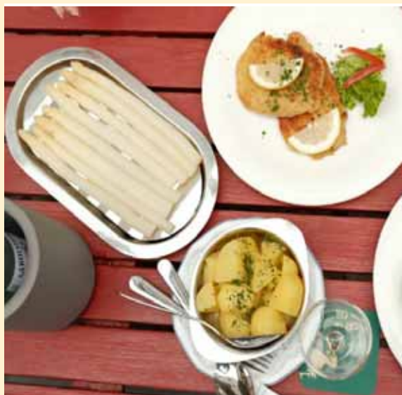
Spargel vom Niederrhein ist eine beliebte Delikatesse.

Niederrhein. Frühling am Niederrhein bedeutet in kulinarischer Hinsicht vor allem eins: Paradiesische Zustände für alle Spargelfans. Der hiesige Anbau des edlen Gemüses hat eine lange Tradition und genießt – nicht zuletzt durch das „Spargeldorf“ Walbeck in Geldern – eine überregionale Popularität. Zahlreiche Höfe haben sich auf Spargel spezialisiert und bieten ihn direkt vom Feld an.