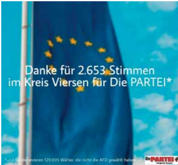
Wahlplakat der PARTEI von 2019: Man beachte die Fußnote.

Niederrhein. Am 9. Juni findet die Europawahl statt, bei der die Abgeordneten des Europäischen Parlaments gewählt werden. Mit 34 Parteien ist der Stimmzettel zur Europawahl in NRW im Vergleich zu anderen Wahlen sehr lang. Jeder Wähler hat eine Stimme und gibt diese einer Partei. Zur Wahl aufgerufen sind auch die ganz Jungen. Und deren Votum hat diesmal besonders viel Gewicht.